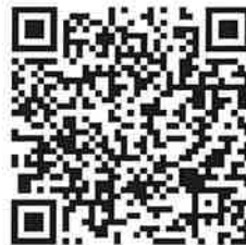
過往六福永續獎影片