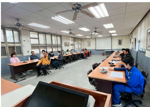
審核 3 月菜單