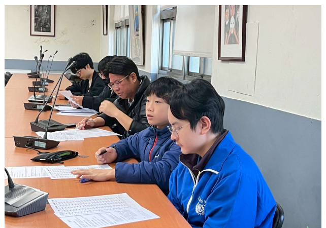
審核 3 月菜單